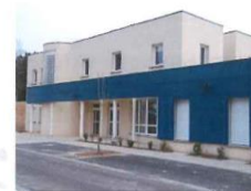
CMP et CATTP De Gisors Route de Rouen 27140 GISORS 02 32 33 89 80