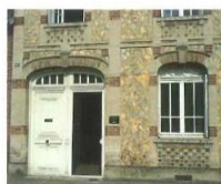
CMP Pont-Audemer 66, rue Jules Ferry 27500 PONT-AUDEMER 02 32 20 60 00