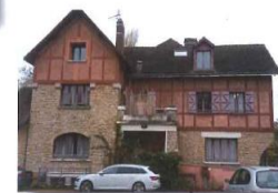
CMP de Vernon 88 rue de Bizy 27200 VERNON 02 32 71 29 20