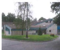
CMP St Michel 20, rue du Dr M. Baudoux 27000 EVREUX 02 32 38 10 36