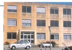
Equipe Territoriale d'Appui au Diagnostic de l'Austime 62, route de conches CS 32204 27000 Evreux 02 32 31 77 98