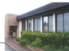
CMP Verneuil 86, rue de la Vannerie 27130 VERNEUIL SUR AVRE 02 32 78 86 21