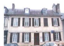
Equipe Mobile Départementale pour Adolescents 28, rue Maréchal Joffre 27000 Evreux 02 32 34 55 33