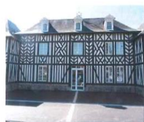
Centre de Soins - Manoir de la Charentonne 26, rue Léprovost 27300 BERNAY 02 32 45 63 14