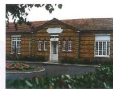
CMP et CATTP de Louviers CHI Elbeuf-Louviers Pavillon St Jacques 2, rue St Jean 27400 LOUVIERS 02 32 40 10 00